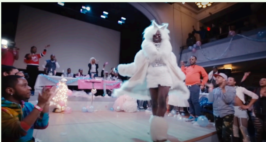
Still de Kiki (2016), Sara Jordenö