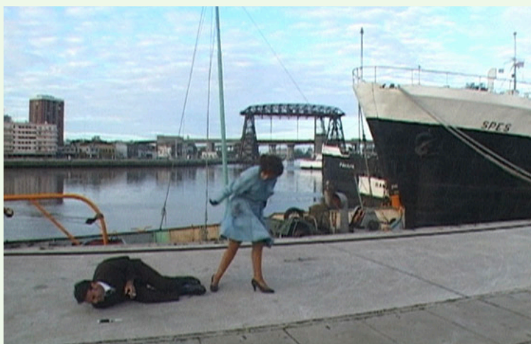
Still de Light at the Edge of a Nightmare (2002–2005), David Lamelas

Con un amplio recorrido internacional tanto como escritor como curador, Cairns desarrolla una práctica de investigación constante, informada por las artes y la cultura contemporánea.