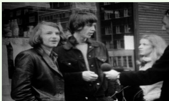
Still de A Study Of Relationships Between Inner And Outer Space (1969), David Lamelas

Este ciclo ofrece una oportunidad única para redescubrir una tradición fílmica muchas veces invisibilizada y comprender cómo el cine de artistas ha ampliado las fronteras del arte y la imagen en movimiento, dejando un legado fundamental para el video contemporáneo.