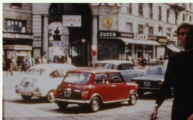
Still de A Study Of Relationships Between Inner And Outer Space (1969), David Lamelas

Este trabajo reciente examina el recorrido artístico de Lamelas y sus investigaciones conceptuales, combinando elementos biográficos con exploraciones de tiempo, lugar y representación. A través de conversaciones con la curadora Carla Acevedo-Yates, Lamelas revisita obras y lugares clave, situando su práctica en un contexto cultural y artístico más amplio.