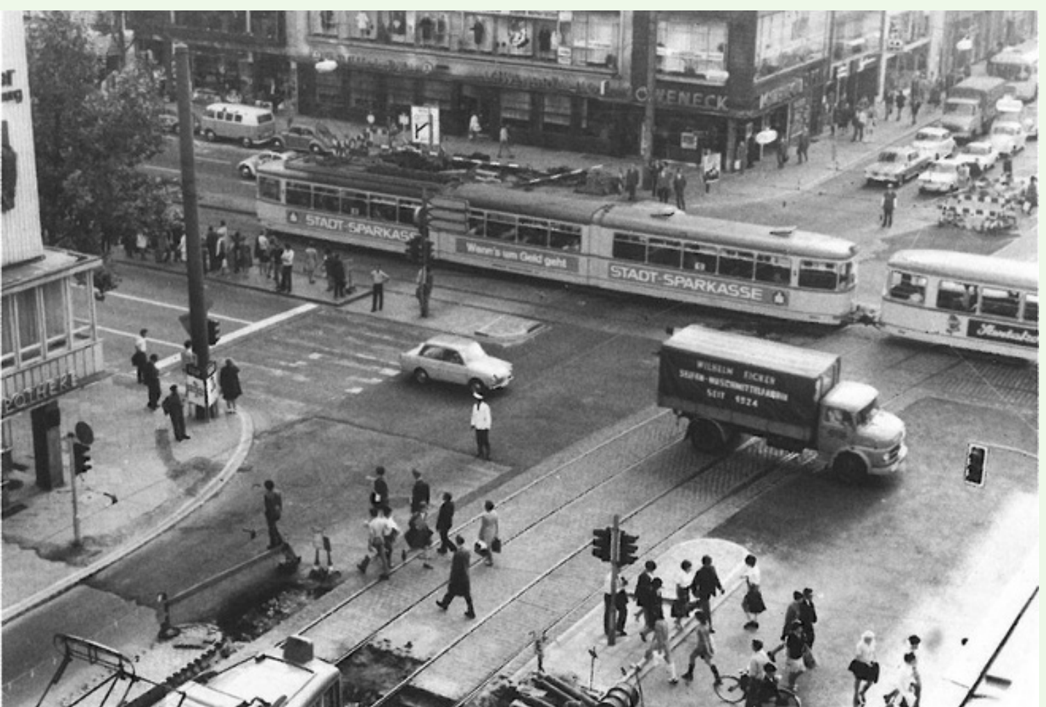
Still de Time As Activity (Düsseldorf) (1969), David LaMela

Se trata de una oportunidad única para sumergirse en la obra de un artista fundamental y entender la profundidad de sus contribuciones al cine y al arte conceptual a través de la mirada e investigación del destacado curador Steven Cairns .