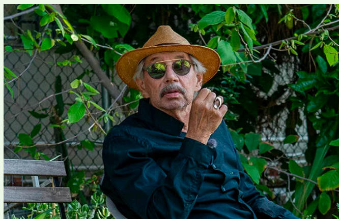
Still de This Is My Place (2023), David Lamelas