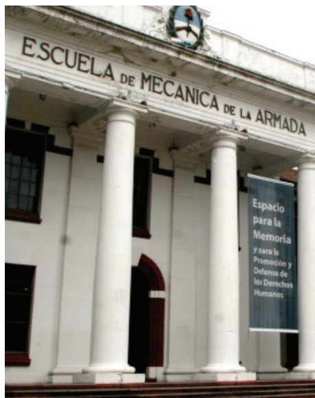
Escuela de Mecánica de la Armada (ESMA)