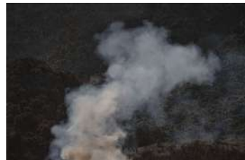
Espectro III , 2019-2021 Copia sobre papel Hahnemühle quemado 62 x 89 cm Cortesía del artista y Ruth Benzacar galería de arte