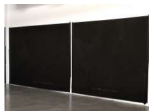
Retén , 2018

Dibujo díptico realizado en carbonilla sobre papel 272 x 412 cm, 272 x 326 cm, c/u