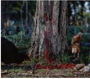
Sin título (Tronco y sangre) de la serie el sexto día , 1996 - 2004 Cibachrome 74 cm x 74 cm Cortesía de la artista