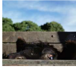
Sin título (Vaca en manga) de la serie el sexto día, 1996 - 2004 Cibachrome 74 cm x 74 cm