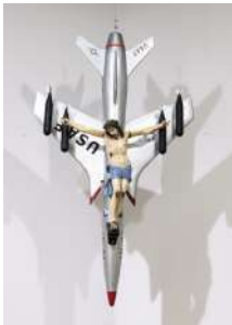
La civilización occidental y cristiana , 1965

Ensamblaje, avión de guerra de madera pintada y Cristo de yeso 200 x 120 x 60 cm Colección Familia Ferrari