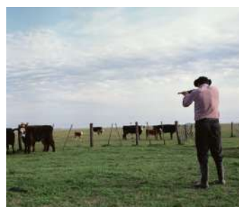
Sin título (Rifle y ternero) de la serie el sexto día, 1996 - 2004 Cibachrome 74 cm x 74 cm