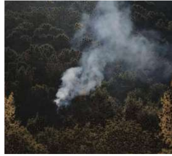
Espectro, 2019-2021 Impresión fotográfica sobre papel Hahnemühle quemado 64 x 69 cm