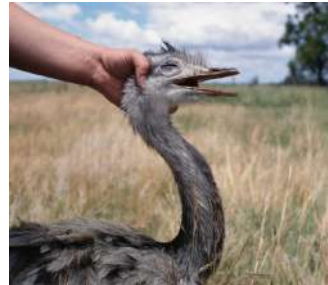
Sin título (Avestruz) de la serie el sexto día , 1996 - 2004 Cibachrome 74 cm x 74 cm Cortesía de la artista