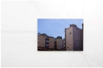
Parcas sobre Buenos Aires , 2014 Bajoacrilico, cuerda e hilos Medidas variables Cortesía del artista y Ruth Benzacar galería de arte