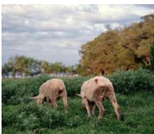
Sin título (Esquiladas) de la serie el sexto día , 1996 - 2004 Cibachrome 74 cm x 74 cm Cortesía de la artista