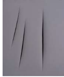
Concetto Spaziale, Attese. Passa un jett, che voglia di partire per l'infinito , 1962

(Concepto espacial, Expectativas. Pasa un jet que quiere llegar al infinito) Óleo y tajos sobre tela 65 x 54 cm Colección Fundación Federico J. Klemm