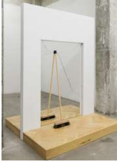
Brooms , 2015

Estructura metálica, tira de acero cromado, 2 escobas, piso de madera 211 x 156.4 x 140 cm