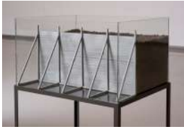
Cómo contener un territorio , 2019 Madera, plástico y tierra 42 x 52 x 147 cm