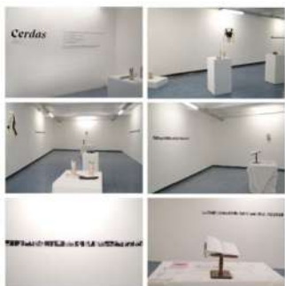
Cerdas / ARO