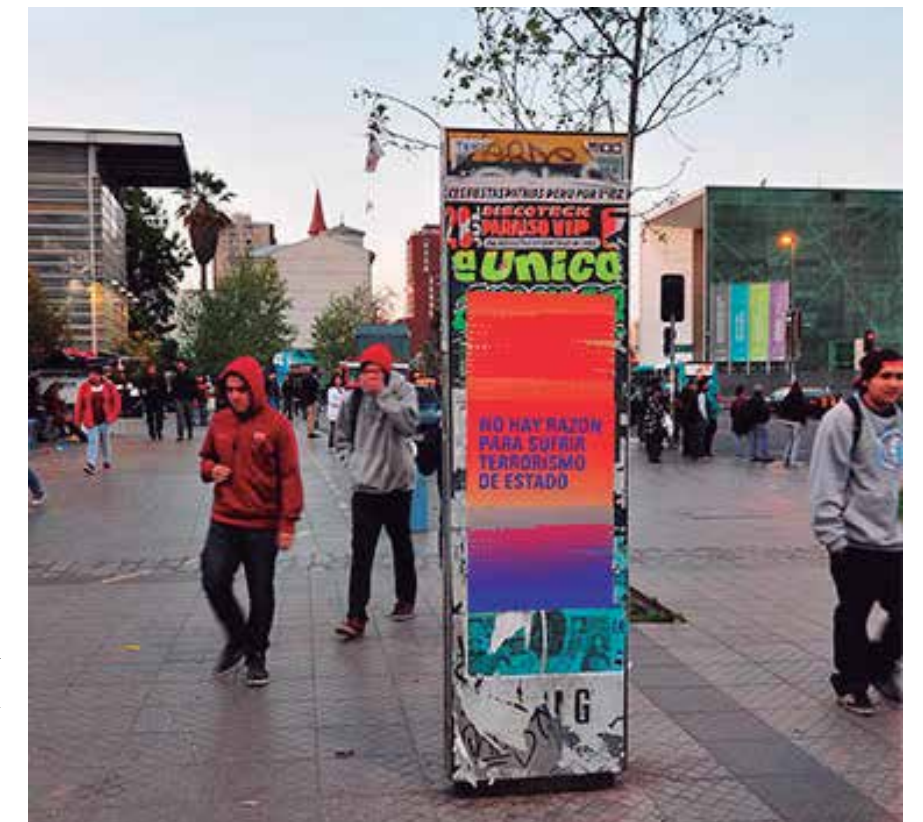
Cuadernos de Movilización Esto no es un museo , 2013 Intervención urbana de dispositivos gráficos, en el marco de la muestra colectiva ESTO NO ES UN MUSEO. Artefactos móviles al acecho, en el MAC /Museo de Arte Contemporáneo, Chile © Cuadernos de Movilización

http://056.io/cuadernos-de-movilizacion-2/