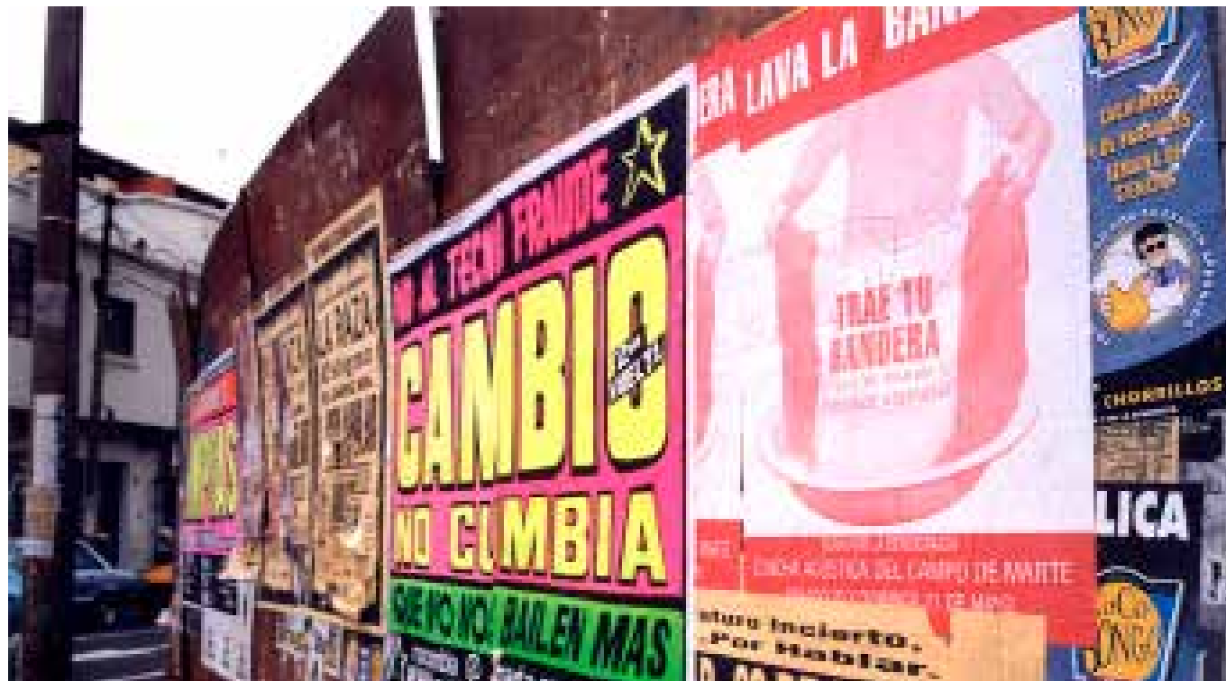
Colectivo Sociedad Civil. Cambio no cumbia , 2000. Afiche: serigrafía sobre papel, 120 x 86 cm

Un momento decisivo, en el año 2000, impulsó sus dos acciones más reconocidas, el fraude electoral que llevó a Fujimori por tercera vez a la presidencia. La primera de las acciones del CSC inició con la impresión de 300.000 bolsas de basura con el rostro de los políticos como presidiarios, descriptos por el grupo como "socios sucios". Las bolsas se distribuyeron masivamente entre la gente, para que sacara la basura a la calle en estos contenedores. Lava la Bandera se constituyó como un gran ritual participativo de limpieza de la patria, llevado a cabo en jornadas sucesivas en la Plaza Mayor de Lima. La persistencia de la acción durante seis meses, contribuyó a la caída del gobierno en noviembre de 2001.