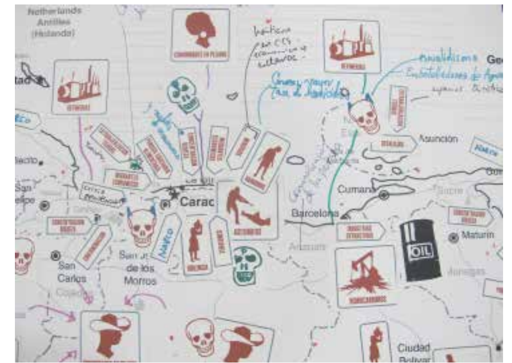
Iconoclasistas. Un breve paseo por el mapeo colectivo , 2012. Presentación en Power Point, 4 '38'

El power point en la exhibición da cuenta del proceso creativo de la agrupación, para la realización de los mapas, la vinculación con los actores, la modalidad de los talleres y los resultados volcados al lenguaje gráfico.