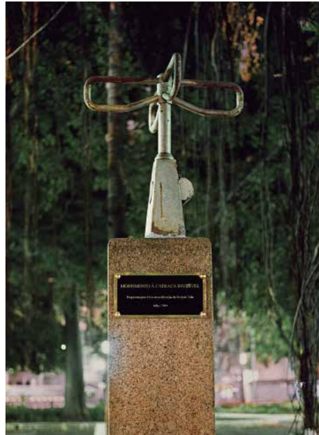
Contrafilé Programa para a descatracalizaçao da vida , 2004 (Programa para la “descatralización” de la vida) Documentación de la acción, San Pablo, Brasil

El Colectivo Contrafilé se formó en Sao Paulo, Brasil, en el 2000. Es un grupo de investigación y producción de arte que trabaja a partir de su experiencia cotidiana y la relación con el espacio público, punto de partida y territorio de proliferación de su trabajo. El grupo de arte e investigación se formó por integrantes de diversas disciplinas y realiza acciones y reflexiones en torno del espacio urbano y de las posibilidades de intervención en la vida pública. Sus acciones más emblemáticas, que forman parte de la exposición, corresponden a una serie de intervenciones y propuestas en torno a “la catraca” (en español: el molinete) que el colectivo define como un objeto de control biopolítico. Así, lanzaron un plan de acción para la “descatracalización” de la vida.