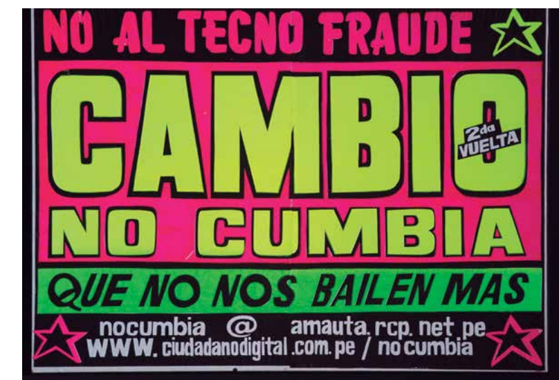
Colectivo Sociedad Civil