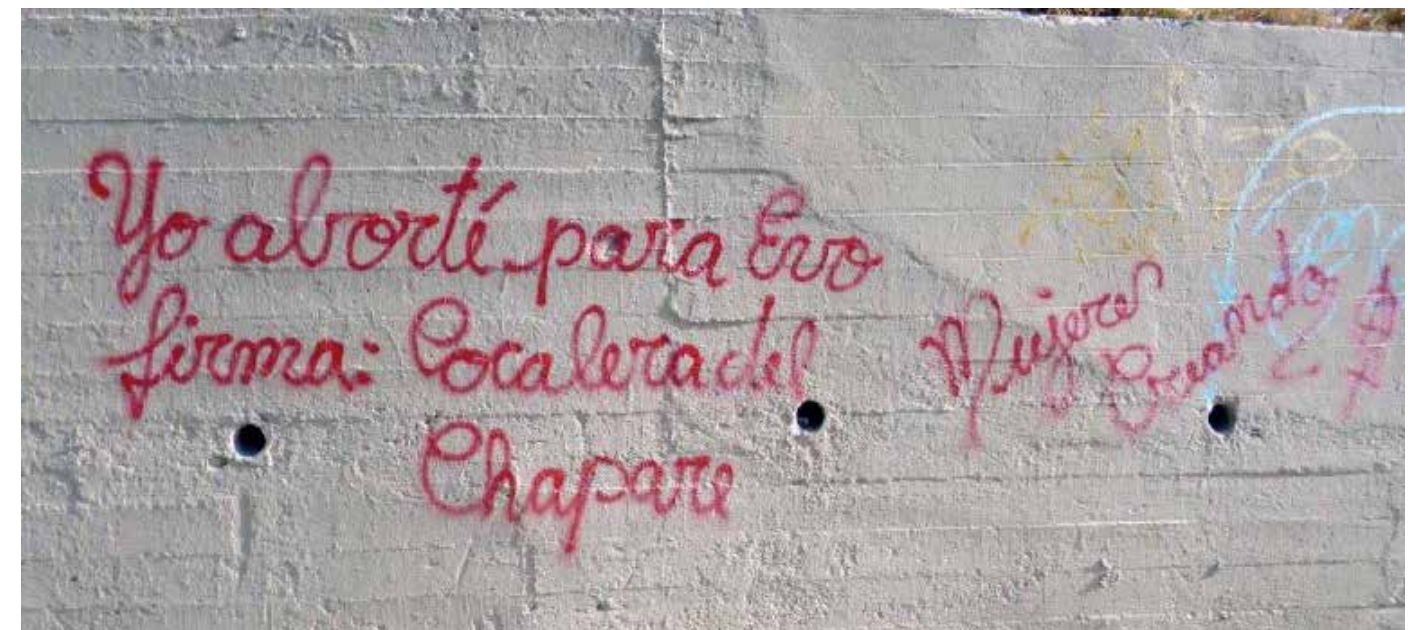
Mujeres Creando.

La producción teórica y la difusión de sus actividades en las redes sociales y su propia emisora de radio "Radio Deseo"; son espacios para el efecto multiplicador de sus acciones.