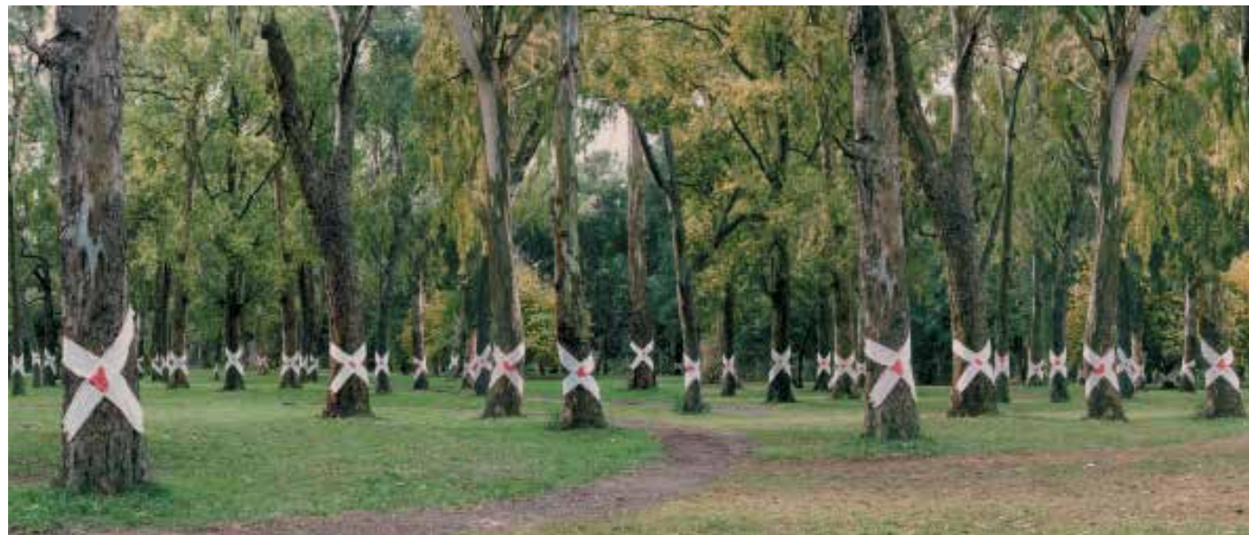
Escombros. Crimen seriado , 1995. Intervención en un bosque de La Plata

Fuentes: http://www.buenosaires.gob.ar/areas/cultura/arteargentino/04biografias/escombros.php http://www.grupoescombros.com.ar/elgrupo.html