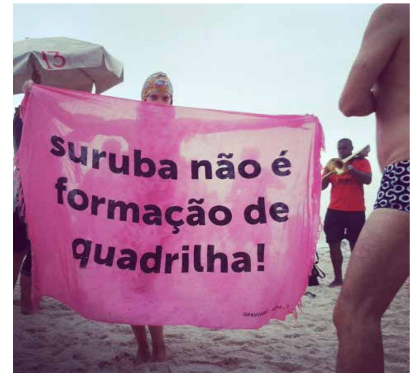
OPAVIVARÁ! Transporte: coletivo, Rio de Janeiro, Brasil, 24/04/2010 (Transporte colectivo). Video 7'.

En 2010, también en diálogo con las condiciones del transporte en Rio de Janeiro, el grupo impulsó la acción Transporte Colectivo , que consistió en crear tres líneas de diez triciclos cada una que, con su propio sistema de recorridos, paradas y señalización, compitieron durante un día con los medios de transporte tradicionales.