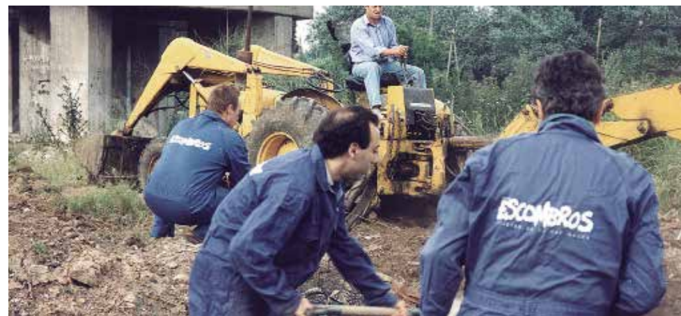
Escombros. Limpieza de un basural, 1995. Documentación fotográfica.

El conjunto de obras que se exhiben aquí se centra en una visión del artista como servidor social. La Limpieza de un basural (1995) y el entierro de un Perro N.N. (1994), llaman la atención sobre la posibilidad de transformar la realidad a partir de acciones simples, desinteresadas y solidarias. En estos mismos años publican el manifiesto "La estética de la solidaridad". Crimen seriado (1995) es una acción de concientización social realizada en el Paseo del Bosque de la ciudad de La Plata, de la cual participan estudiantes, ecologistas, ciudadanos y los artistas. Con la consigna "Cuando la naturaleza deje de ser expoliada, la sociedad dejará de serlo", colocan vendas sobre más de 700 árboles, confiriendo entidad visual a un problema que afecta a la comunidad en su conjunto.