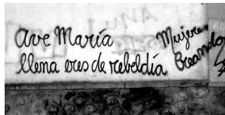
Mujeres Creando. Ave María

Fuera del museo, pero respetando las reglas de convivencia, los artistas toman los lenguajes de los medios masivos de comunicación y la publicidad. Re-territorializan los espacios y los conceptos empleando estrategias que articulan los lenguajes del arte. La acción es afirmación de la ciudadanía individual y apela a la participación del público rescatando elementos de la cultura popular y masiva.