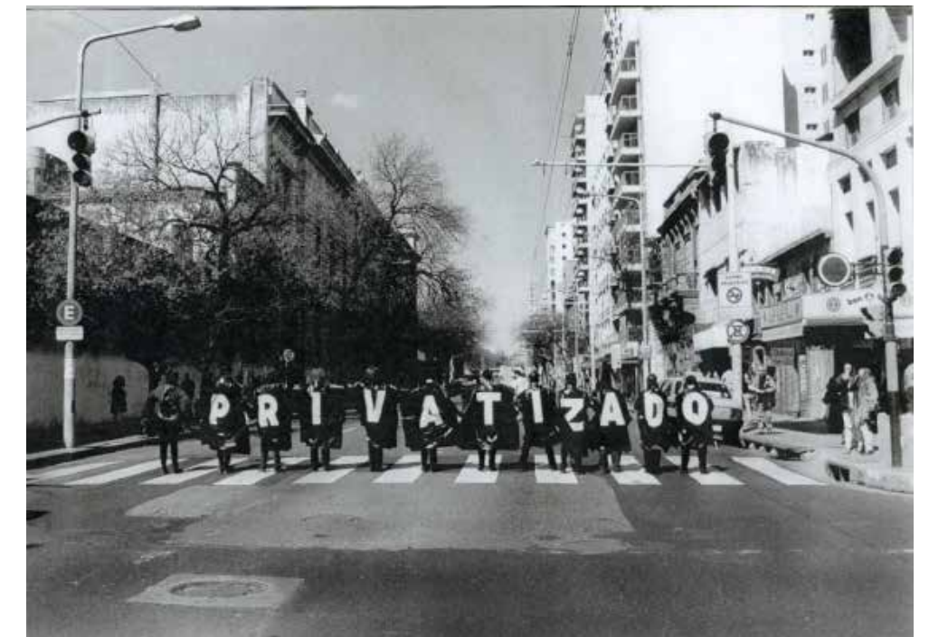
Costuras Urbanas. Privatizado , 1997. Córdoba, Argentina.

Fuentes: www.vivodito.org.ar/node/126 http://costurasurbanas.blogspot.com.ar/