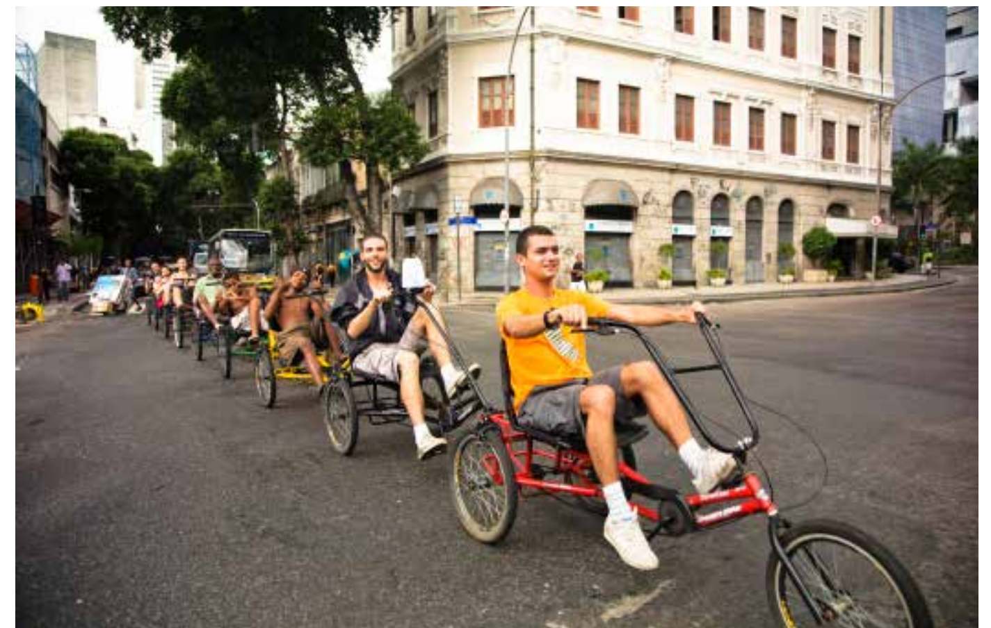
OPAVIVARÁ! Transporte coletivo, Rio de Janeiro, Brasil, 2010 (Transporte colectivo)

Sus trabajos responden a sus contextos sociopolíticos inmediatos e impugnan las conductas naturalizadas mediante propuestas que abordan cuestiones de género, discriminación racial, indigenismo, desigualdad política y alienación, entre muchas otras. Cuestionan tanto a la institución artística como a ciertas estructuras sociales, pero a diferencia de las organizaciones militantes, alcanzan su momento crítico a través de acciones poéticas.