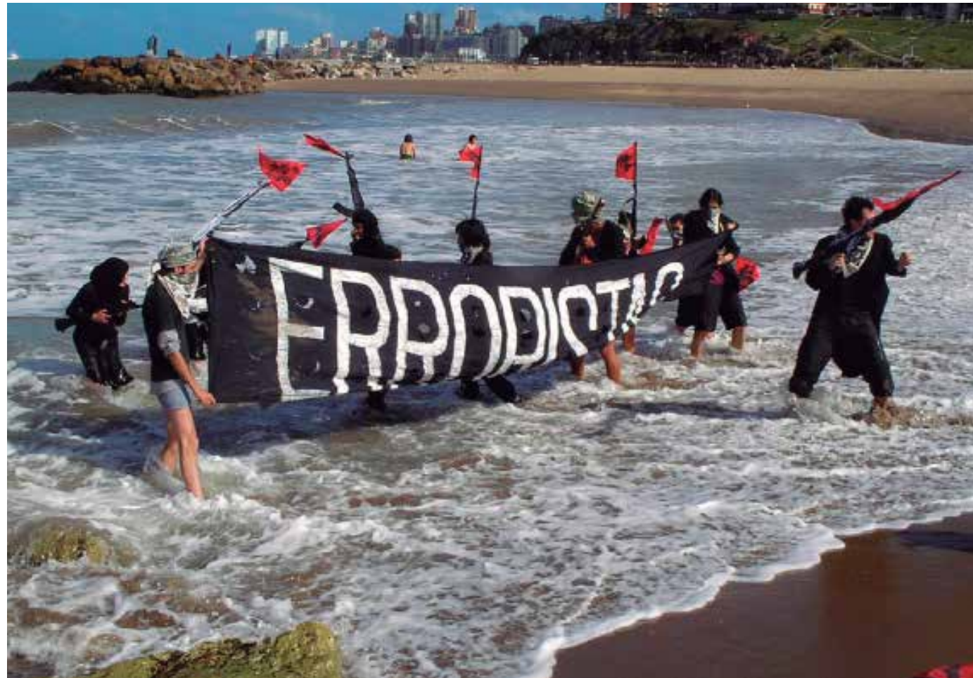
Etcétera. OPERACIÓN B.A.N.G. Desembarco errorista en la Cumbre de las Américas. Mar del Plata. 2005. Registro fotográfico de la acción, Mar del Plata, Argentina.