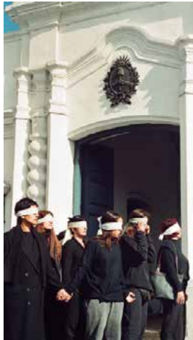
Viva Laura Pérez Sobrevidentes , 2002 Intervención urbana en las calles de San Miguel de Tucumán, Argentina.

Fuentes: http://www.buenosaires.gob.ar/areas/cultura/arteargentino/04biografias/viva_laura_perez_grupo.php http://www.boladenieve.org.ar/artista/557/viva-laura-perez-grupo