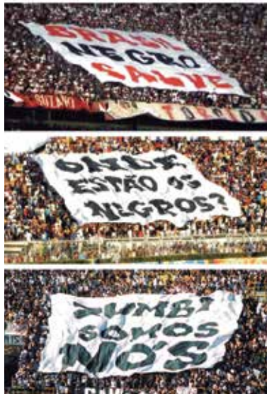
Frente 3 de Fevereiro. Zumbi Somos Nós, Brasil Negro Salve y Onde Estão os Negros? , 2007

Fuentes: http://es.wikipedia.org/wiki/Mujeres_Creando http://www.mujerescreando.org/