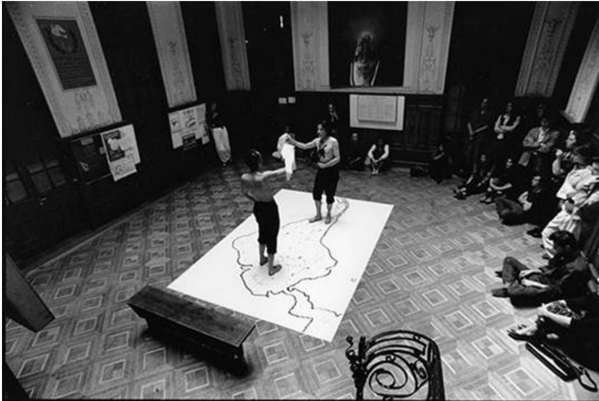
Yeguas del Apocalipsis. La conquista de América, 1989, Fotografía, 60x39,7 Préstamo Galería D21

DEL SÁBADO 5 DE OCTUBRE A DICEIMBRTE DE 2019 Jueves a domingo de 15 a 19hs. Ingreso Gratuito.