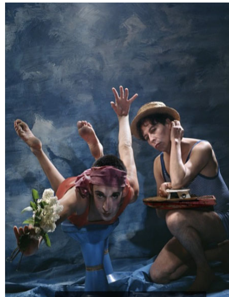
Tristeza de juguete antiguo