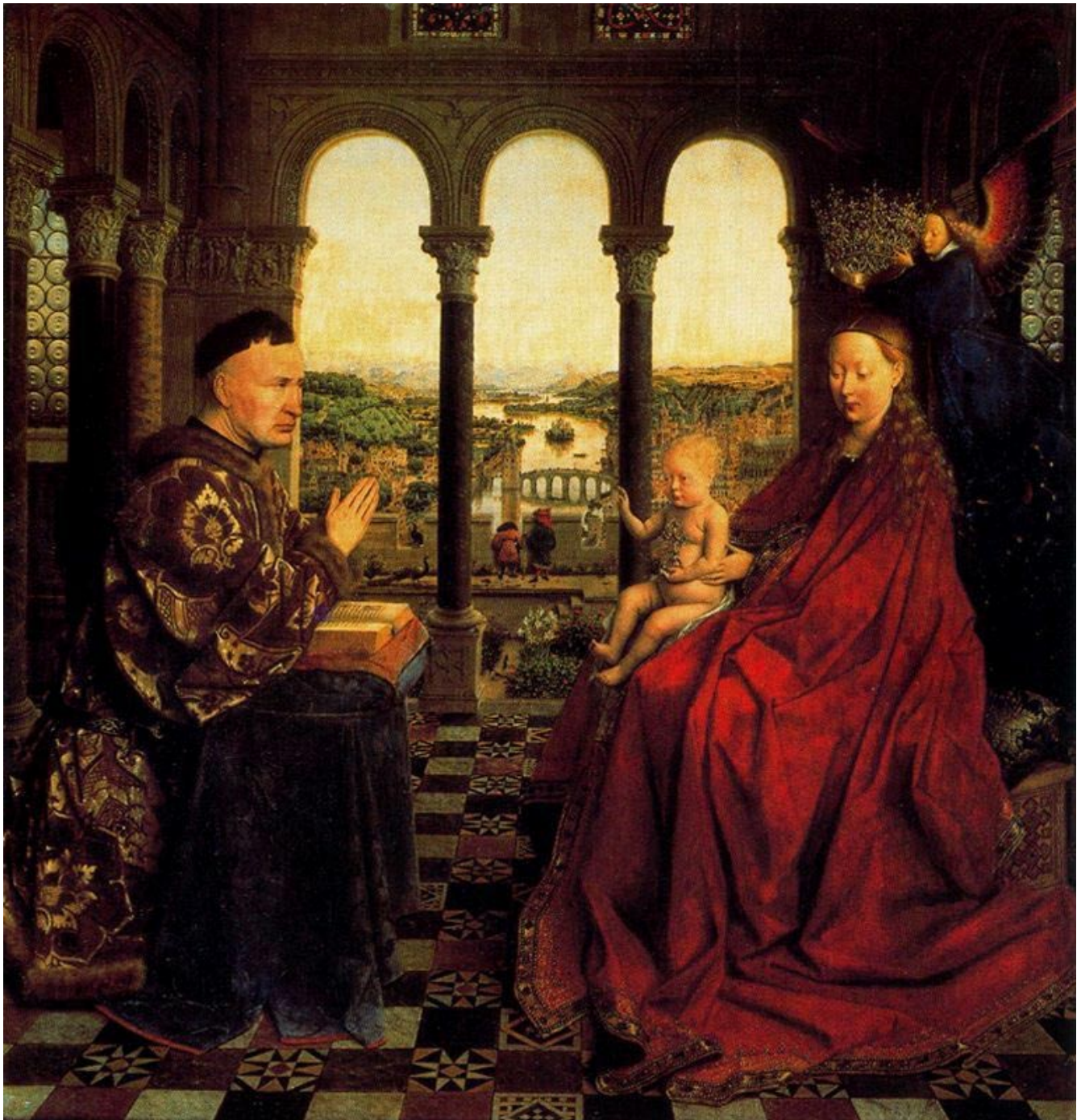
Obra 3 / Jan Van Eyck La Virgen del Canciller Rolin