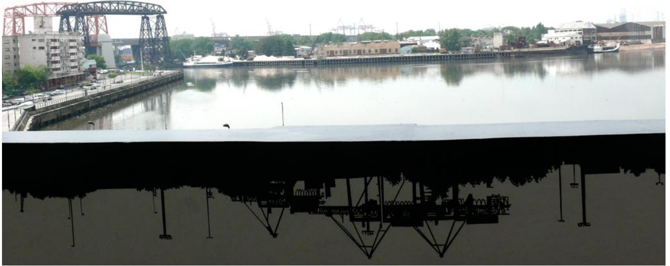
Obra 5 / Marcela Sinclair Crecida