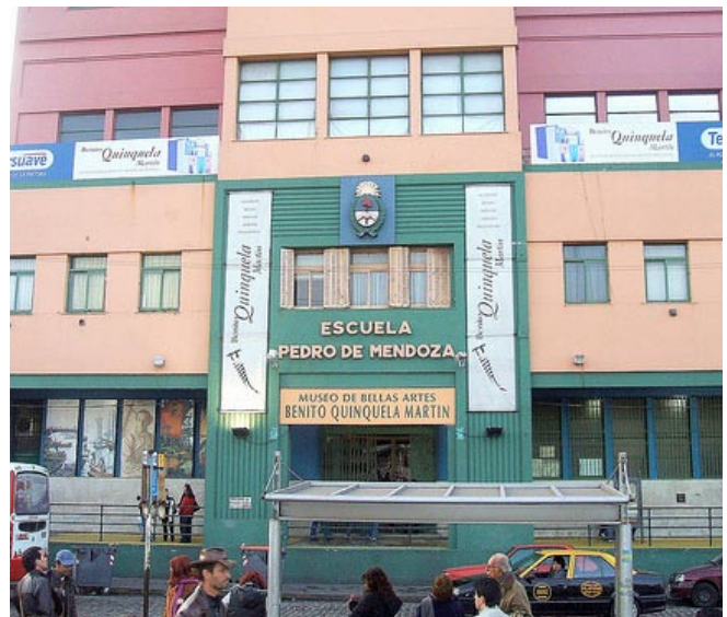
Museo Benito Quinquela Martín