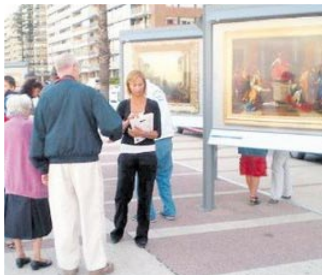
Paseo de la Ribera