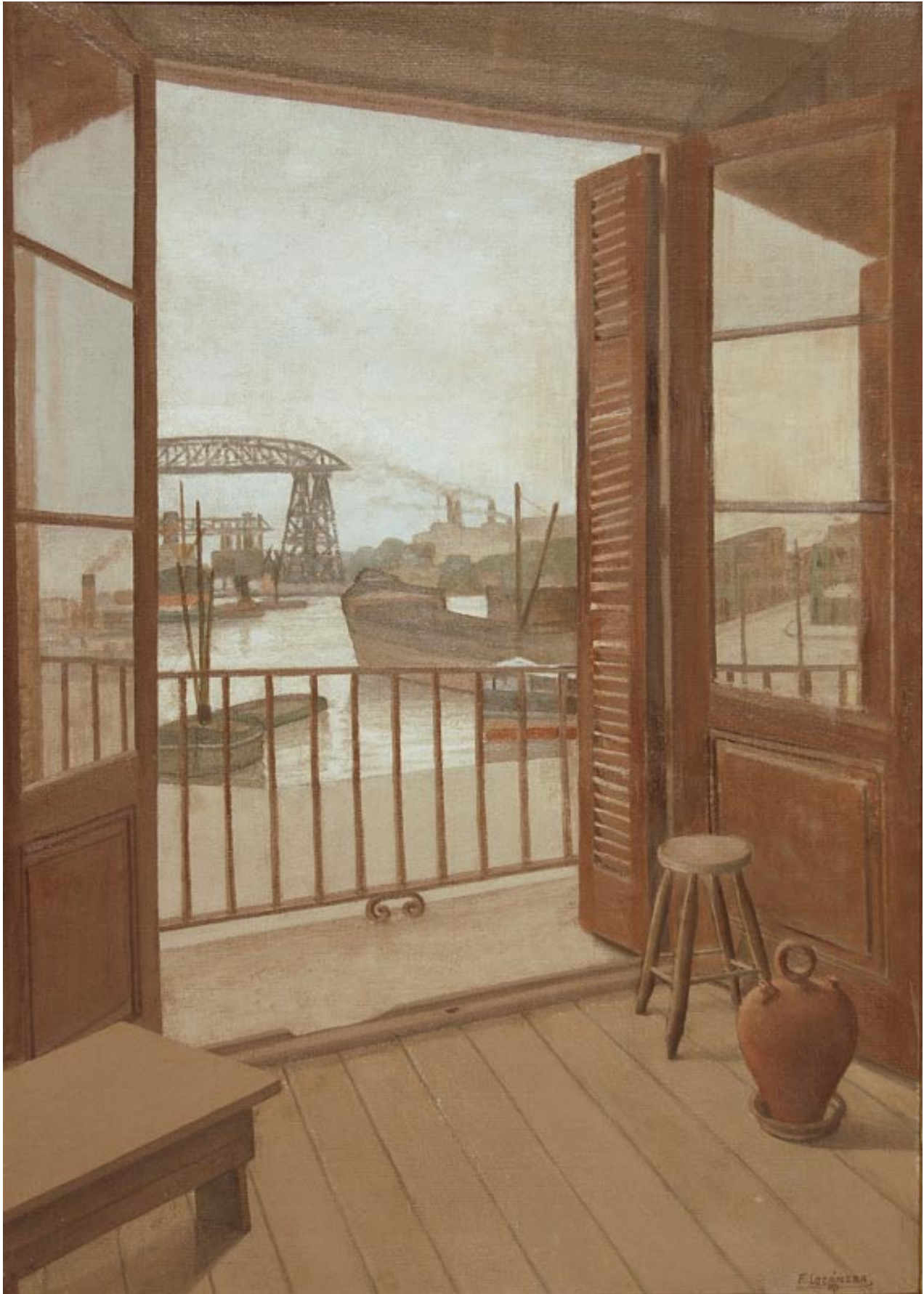
Obra 1 / Fortunato Lacámara Desde mi estudio