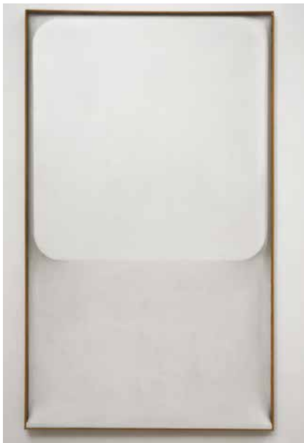
Schermo , 1973 (Pantalla). Tela de lona, madera © Studio Fabio Mauri, Roma