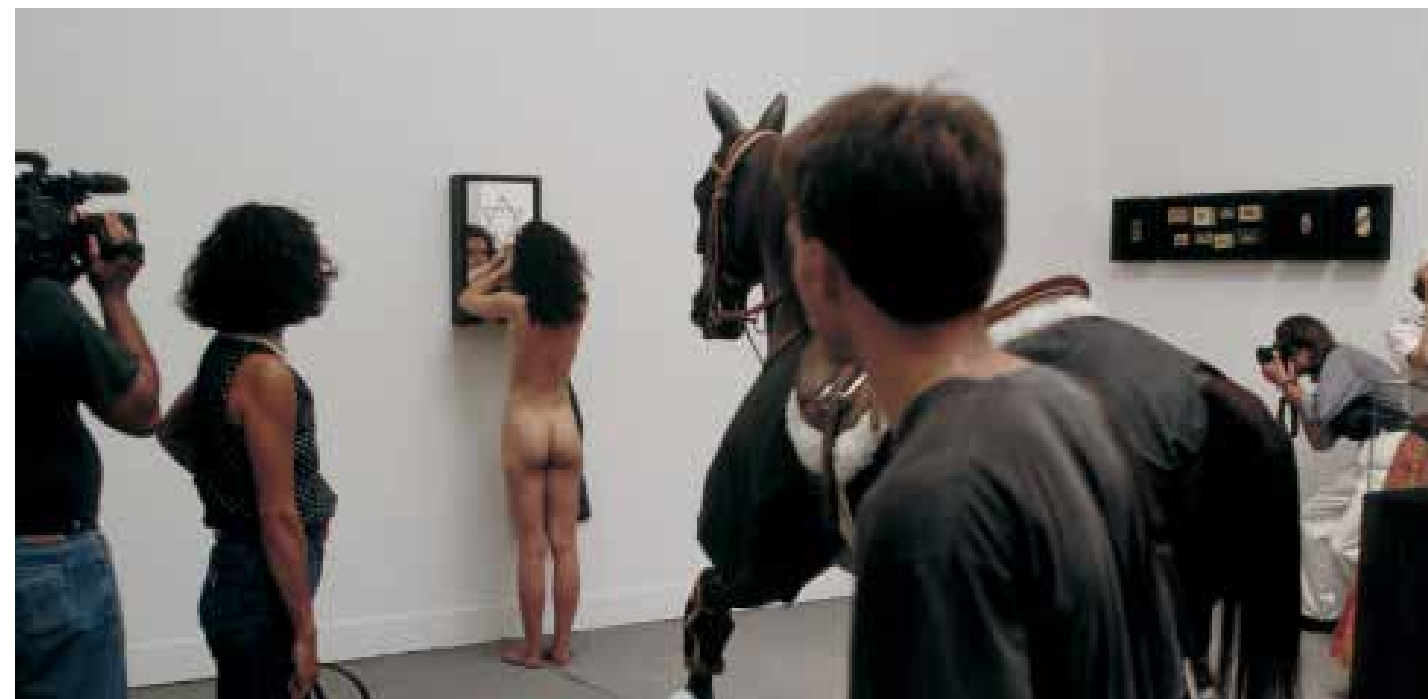
Ebrea , 1971 (Judía). Galleria La Salita, Roma.

Si Ebrea , con la figura femenina sola entre objetos mudos, es una melancólica performance de la soledad, Che cosa è il fascismo y de Gran Serata Futurista 1909-1930 , son performances de la multitud, donde el acento está puesto en el aspecto público y menos íntimo, donde la marca es la vitalidad (real en la segunda, aparente en la primera), donde no sólo muchos performers atiborran la escena, sino que muchos colaboran. Una solitaria figura femenina es la protagonista de Natur e cultura , presentada en la Galleria 2000, de Bolonia, en 1973, y luego vuelta a representar varias veces bajo el título de Ideologia e natura .