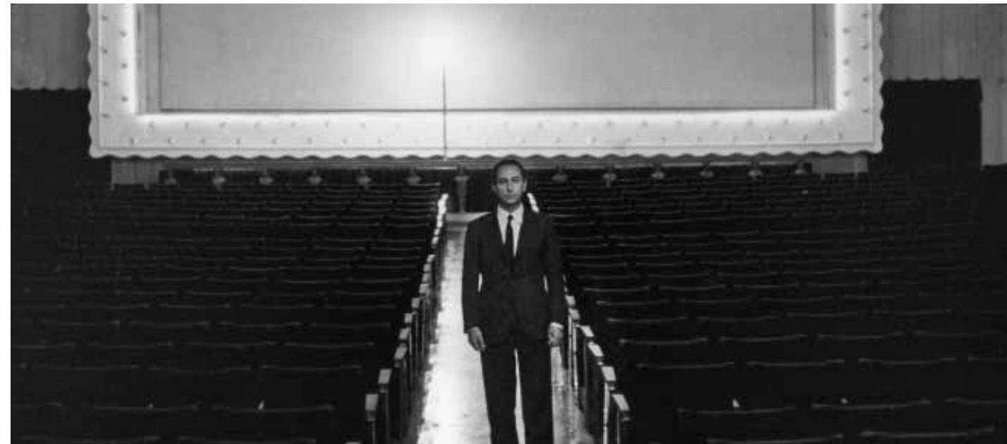
Fabio Mauri, 1962. Cinema Metropolitan, Via del Corso, Roma Foto: Mario Dondero © Studio Fabio Mauri, Roma