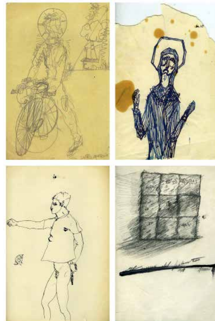
Diseño, ca. 1950 (Dibujos) © Studio Fabio Mauri, Roma

los primeros Dick Tracy de Andy Warhol, collages de pinturas y de pedazos de historietas impresas, que son de 1960, y por lo tanto, posteriores a la obra análoga de Mauri”. El signo negro es usado como lenguaje que construye una narración y alude ya a un universo mediático. El horizonte es aquel de la iconosfera urbana. Emilio Villa, gran figura intelectual de la Roma de la década de 1950, publicó en el segundo número de la revista Appia , de 1960, algunos dibujos-collages de Mauri de 1959, y otros más aparecen ese mismo año en el volumen Crack , con texto de Cesare Vivaldi. The End , de 1959, aparece partido en dos zonas: la superior, donde el signo se vuelve tachadura, y la inferior, donde aparece escrito “THE END” (la misma frase ya aparecía escrita en un dibujo de 1957). Este dibujo representa un momento muy preciso de pasaje hacia el ciclo de las Pantallas .