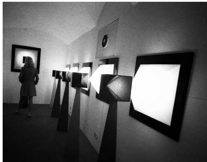
Cinema a luce solida , 1968 (Cine de luz sólida) © Studio Fabio Mauri, Roma

http://www.fabiomauri.com/it/installazioni/cinema-luce-solida.html