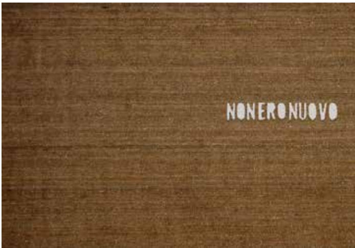
Non ero nuovo , 2009 (No era nuevo) © Studio Fabio Mauri, Roma