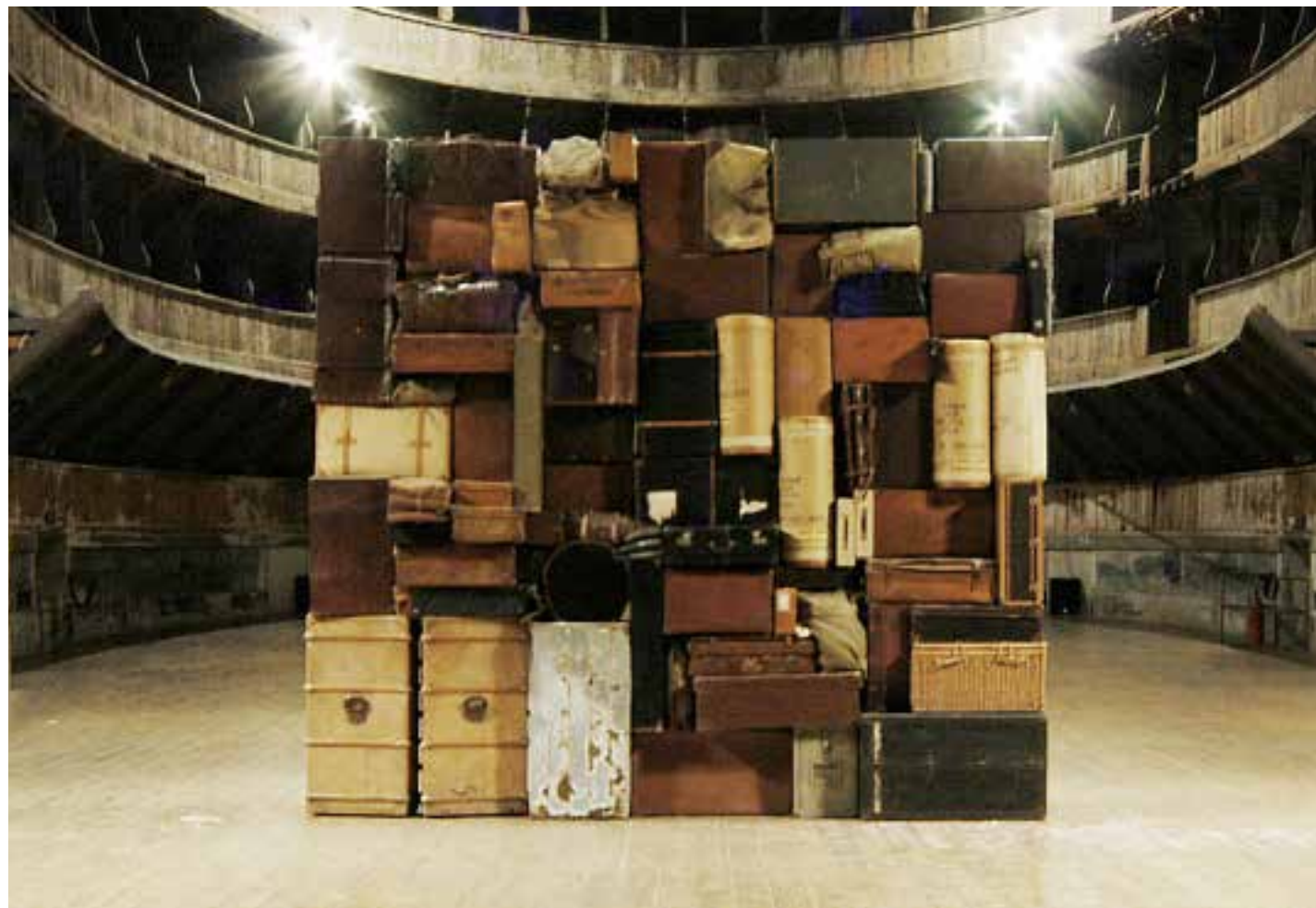
Il Muro Occidentale o del Pianto, 1993. (El Muro Occidental o de los Lamentos) Galleria d'Arte Moderna e Contemporanea, Bergamo 2005

http://www.fabiomauri.com/it/installazioni/muro-occidentale-o-del-pianto.html