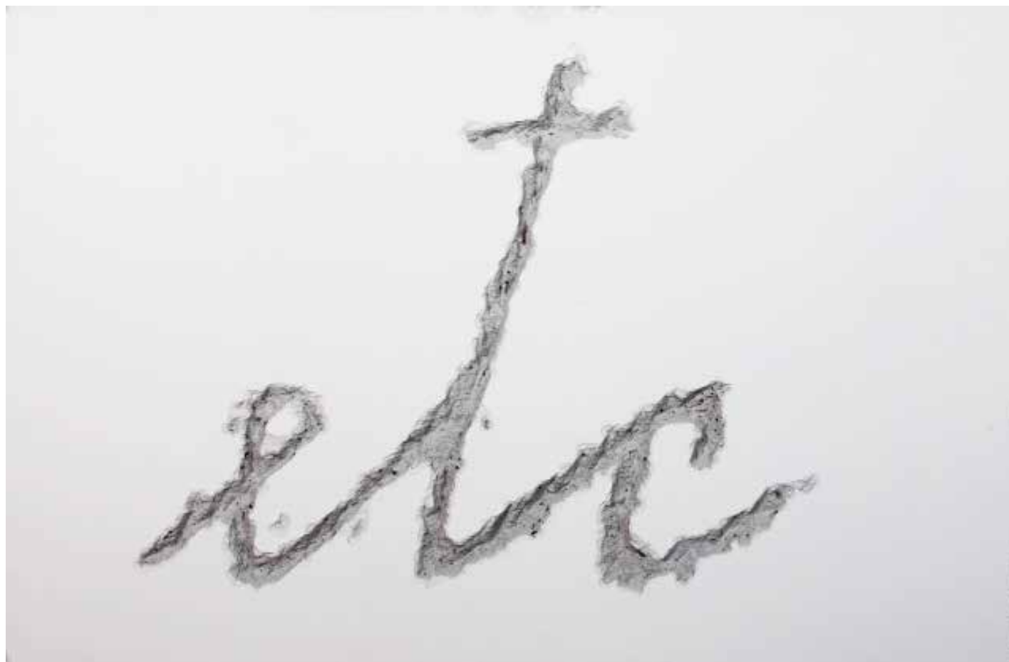
Etc. 2009

*Todas las obras pertenecen al Studio Fabio Mauri