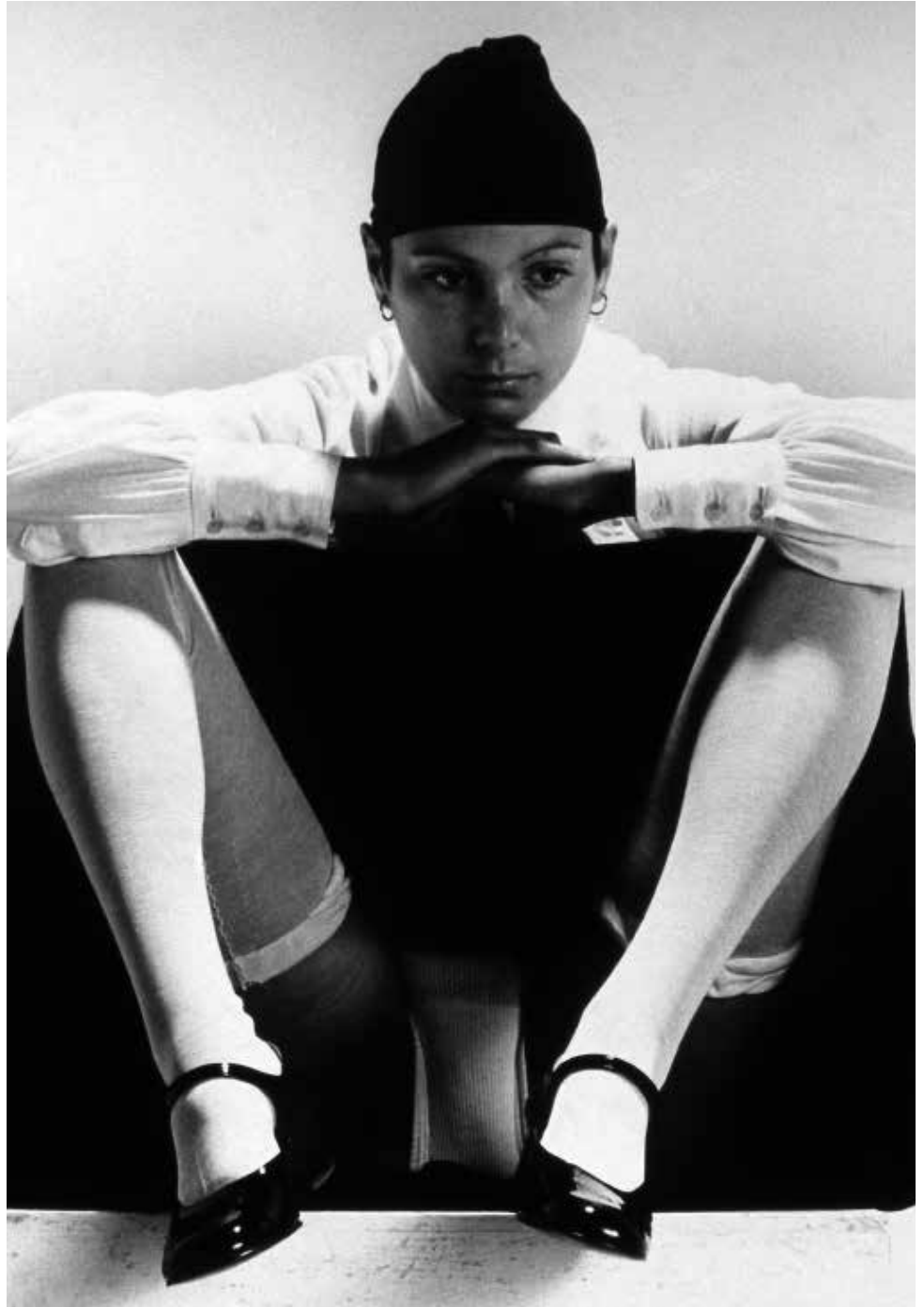
Ideologia e Natura , 1973 (Ideología y Naturaleza) © Studio Fabio Mauri, Roma