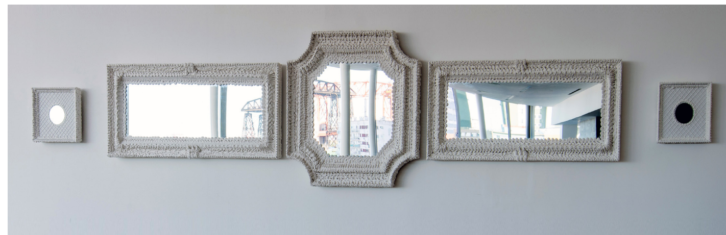
Luciana Rondolini La naturaleza de un hecho es la ironía , 2014