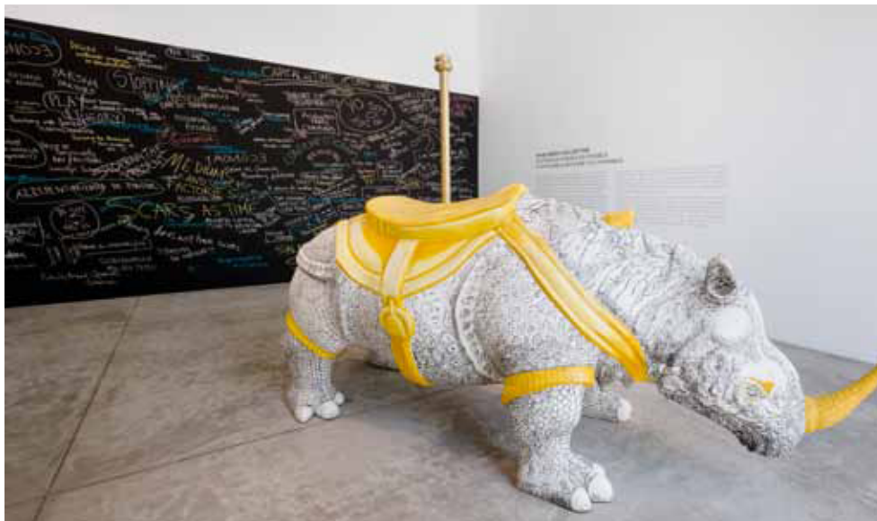
Raqs Media Collective, No obstante incongruente, 2011