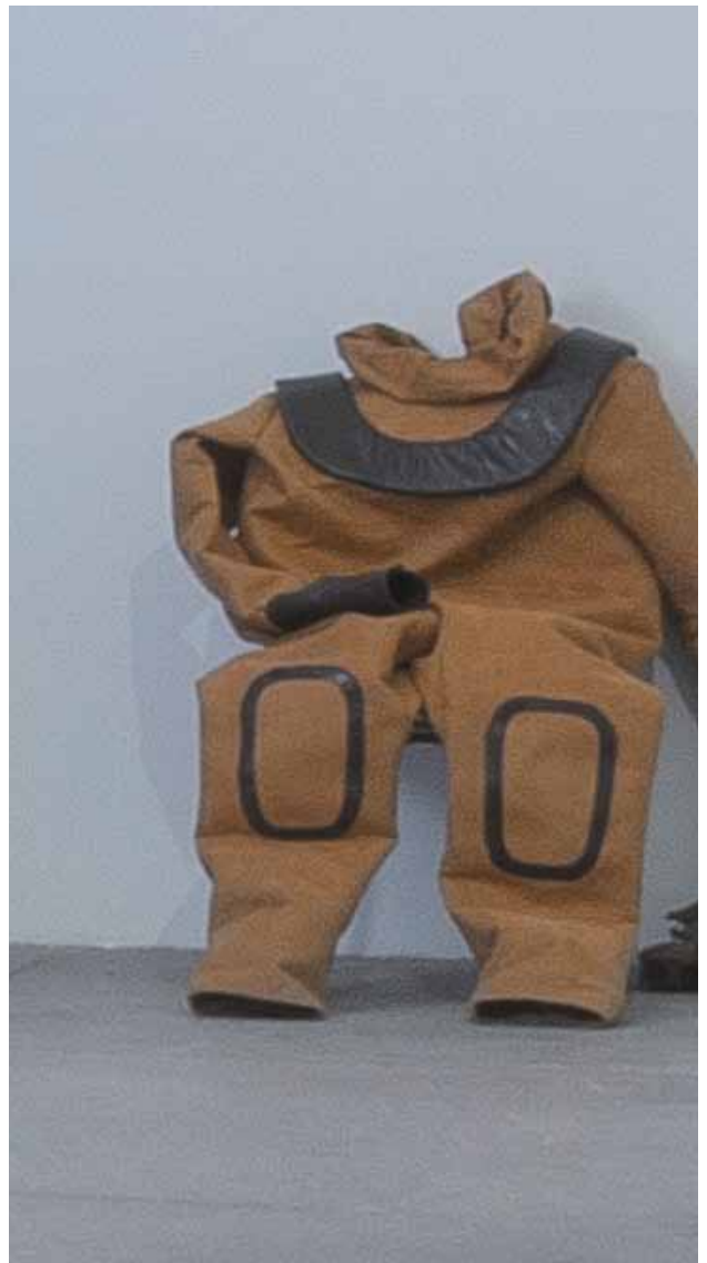
Raqs Media Collective, No obstante incongruente , 2011

Incluye imágenes de las exposiciones de Raqs donde los textos han aparecido anteriormente.