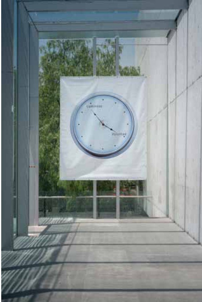
Raqs Media Collective, No obstante incongruente , 2011

[...] El mejor tipo de arte, como la lluvia, invoca un reordenamiento de los campos cognitivos y sensoriales. El arte pide a sus públicos, tanto reales como potenciales, que abran puertas y ventanas y que dejen que otros mundos entren en ellos. Este reordenamiento—sutil, ligero, obvio, fuerte o suave, según sea el caso, ya si se trata de una llovizna desganada que pasa a través de algunas sinapsis agotadas o hastiadas, o el equivalente neurológico de un inesperado chubasco torrencial con tormenta eléctrica— es la razón por la que nos tomamos la molestia de crear arte en primer lugar. Cuando