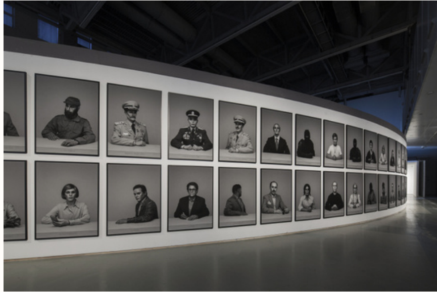
Régimen en la XII Bienal de Shanghai

instalación de 58 fotografías, 115 x 82 cm (c/u)