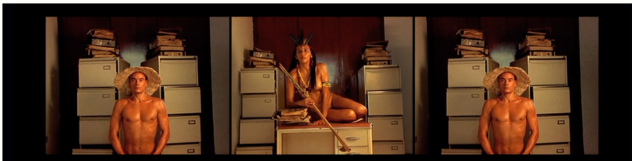
Ensayando la postura nacional (2010)

En 2012 fue curador de Manifesta 9: The Deep of the Modern en Genk, Bélgica y fue premiado con el Walter Hopps Award for Curatorial Achievement de la Menil Foundation. En 2018 curó la 12a Bienal de Shanghai titulada "Proregress" en la Power Station of Art. Entre sus libros se encuentran Abuso Mutuo. Ensayos e Intervenciones sobre arte postmexicano (1992-2013) (Cubo Blanco y RM, 2017) y Una ciudad ideal: la Olinka del Dr. Atl (Colegio Nacional, 2019).