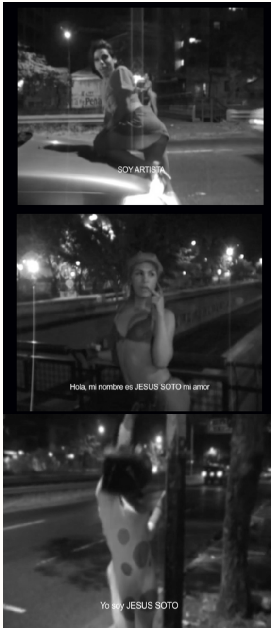
Av. Libertador (2006)

Av. Libertador muestra a travestis y personas trans que ofrecen trabajo sexual en una importante avenida de la ciudad, presentándose la cámara como Gego, Jesús Soto, Carlos Cruz-Díez y otros artistas emblemáticos del arte moderno venezolano. La intervención de personas marginales y queer, que encarnan el valor del capital en el cuerpo, pone en cuestión el utopismo del arte constructivista venezolano, en una subversión de la lógica de género tanto del arte moderno como del desarrollismo. La avenida era entonces, por lo demás, una puesta en escena de la dicotomía política/estética venezolana: de un lado estaba decorada con murales figurativos bolivarianos, del otro lado con ornamentaciones abstractas geométricas.