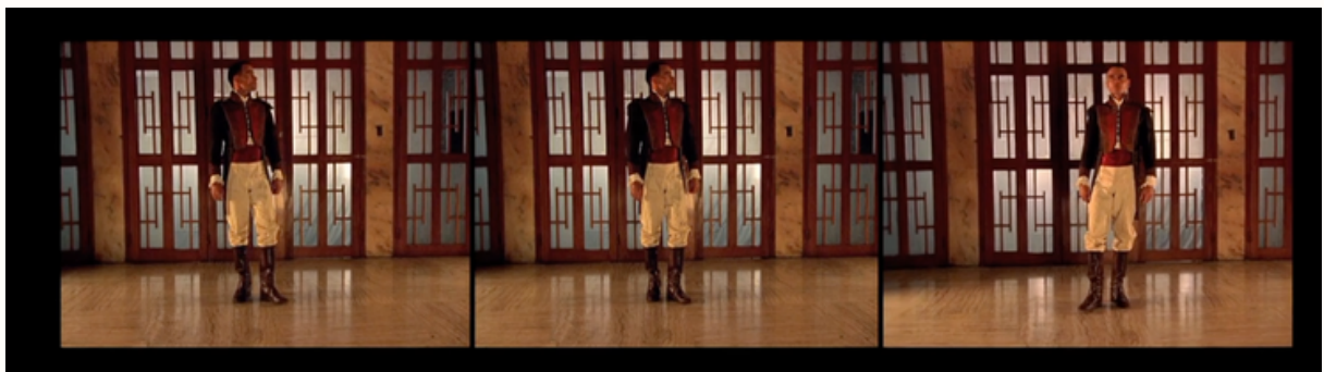
Ensayando la postura nacional (2010)