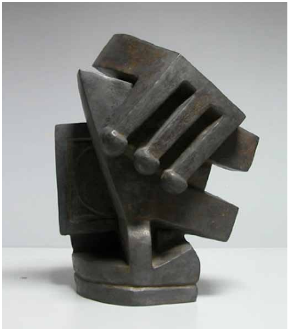
Alberto Giacometti. Composition, dite cubiste II, vers 1927 . Fondation Giacometti

Tres ediciones del ciclo de intervenciones especiales en el edificio de Proa a cargo de curadores invitados.