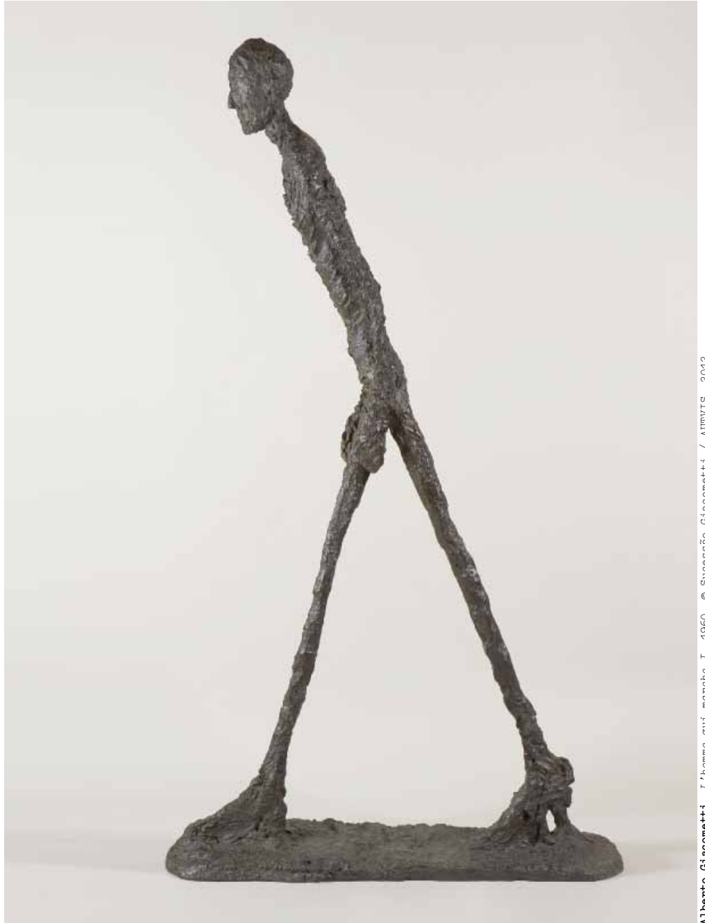
Alberto Giacometti. L'homme qui marche I , 1960. © Sucessão Giacometti / AUVVIS, 2012