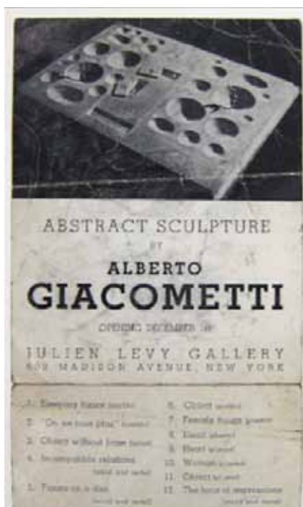
Abstract sculpture by Alberto Giacometti, carton d'invitation à l'exposition à la galerie Julien. Levy, New York, 1934

Un evento en el que los más relevantes estudiosos y especialistas sobre Giacometti expondrán sus recientes escritos, y dialogarán con los expertos locales. Un encuentro necesario, en el marco de una exhibición única.