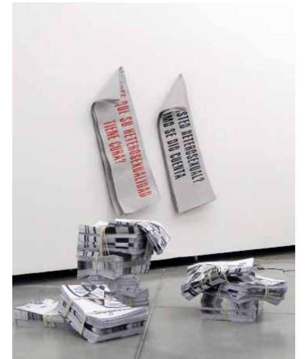
Mujeres Públicas. Instalación documental (2003 - 2010), 2014. Afiches, gráfica, objetos

http://www.buenosaires.gob.ar/areas/cultura/arteargentino/04biografias/mujeres_publicas_grupo.php http://www.ramona.org.ar/node/47817