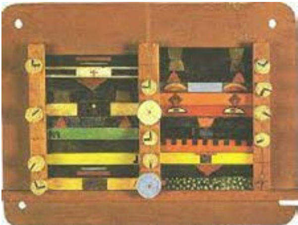
Xul Solar, Tablero I Ching , 1954.

El sábado 18 de diciembre de 2021, se inaugura en las salas de Fundación Proa la exhibición Arte en juego . Una aproximación lúdica al arte argentino, con curaduría de Rodrigo Alonso. La muestra pone de manifiesto la importancia que poseen los juguetes, los juegos, los deportes y las propuestas participativas en la inspiración y el imaginario de los artistas argentinos. Integrando el trabajo de realizadores de diferentes generaciones y extracciones estéticas, ofrece una mirada inusual sobre la cantidad y variedad de producciones históricas y contemporáneas que destacan el valor de lo lúdico como herramienta de creación y reflexión.