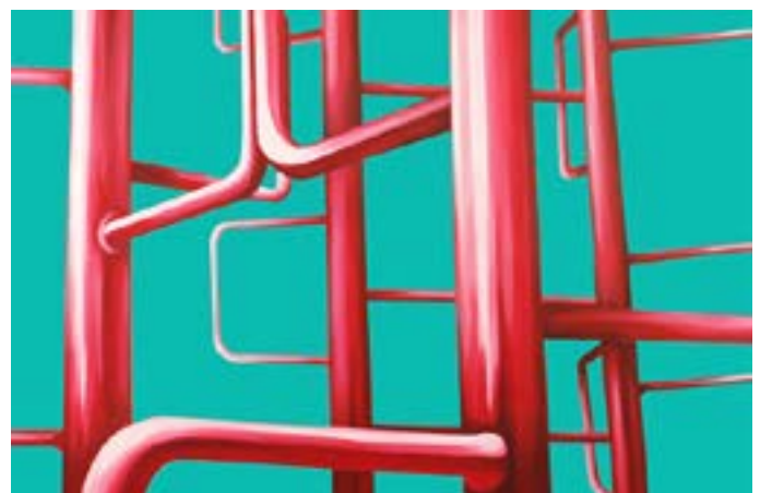
Valeria Calvo. Serie de Trepadores 5 , 2009.

La selección de obras incluye los más variados soportes: pintura, escultura, instalación, fotografía, video, objetos, arte interactivo. La exposición se complementará con un programa de actividades para los públicos más diversos que se desarrollarán durante todo el verano.