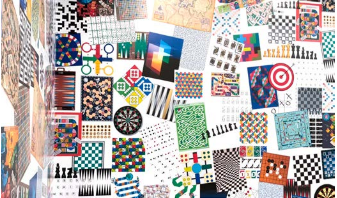
Daniel Joglar. Sin título, 2021

La exhibición Arte en juego comienza con una instalación mural realizada por el artista marplatense Daniel Joglar, quien crea una obra abstracta sobre las paredes de la Fundación combinando un gran número de tableros y artefactos pertenecientes a juegos de mesa. Con estas estructuras, modulares y aleatorias, compone un collage a modo de wallpaper, que remite a las construcciones geométrico-abstractas típicas de los tableros. La instalación se completa con objetos de tres dimensiones, juguetes y fotografías de niños jugando.