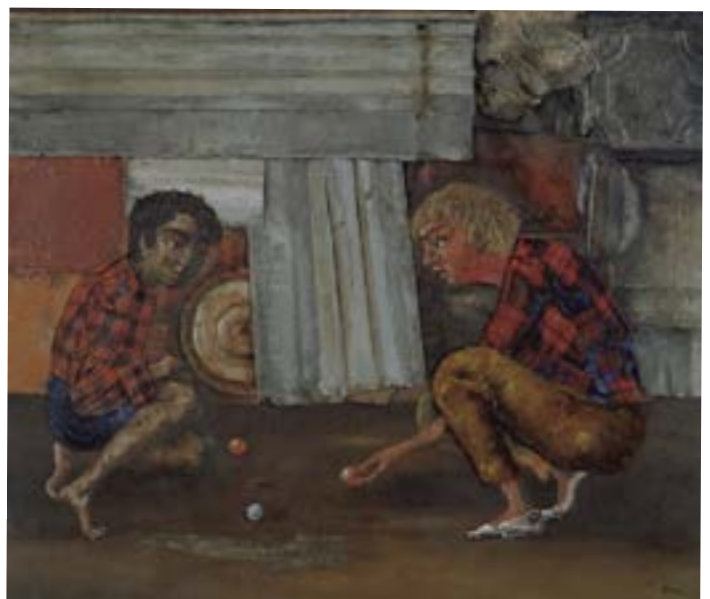
Antonio Berni. Juanito jugando a la bolita , 1973.