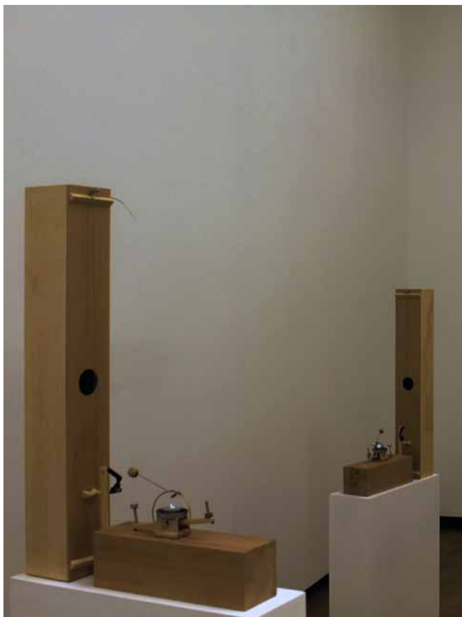
Edgardo Rudnitzky. Nocturno , 2012. Instalación sonora para 15 monocordios